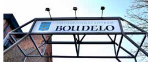
Stekene bruist p. 3