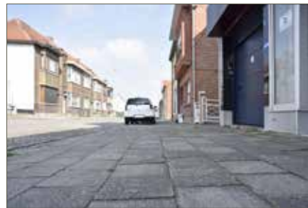
▲ En op dit ogenblik zijn we volop bezig met de ‘Kerkstraat’ en omgeving. Nog enkele maanden doorbijten en de aloude straat met de slechte kasseien zal er mooi en modern bijliggen.